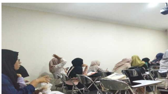
Gambar 1. Proses Perkuliahan

Hasil observasi pada mata kuliah Psikologi Pendidikan Islam (8 Oktober 2025) memperkuat temuan ini. Mahasiswa yang sejak awal bercita-cita menjadi guru agama tampak lebih aktif, disiplin, dan antusias mengikuti perkuliahan. Mereka lebih sering bertanya, berdiskusi, serta memiliki interaksi yang baik dengan dosen. Dari 21 mahasiswa yang hadir, 12 mahasiswa (57%) terlibat aktif dalam diskusi kelas. Data ini menunjukkan bahwa mahasiswa yang memiliki cita-cita menjadi guru agama sejak awal memiliki tingkat partisipasi dan komitmen belajar yang lebih tinggi dibandingkan mahasiswa lain. Cita-cita akan memperkuat motivasi belajar mahasiswa baik intrinsik maupun ekstrinsik (Krasten Hard, 2024).