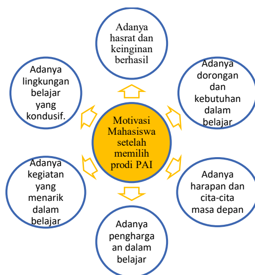
Gambar 2. Deskripsi Motivasi mahasiswa setelah memilih Prodi PAI

Berdasarkan hasil wawancara dengan beberapa mahasiswa PAI angkatan 2024, ditemukan bahwa motivasi belajar mahasiswa Setelah memilih Prodi pendidikan agama Islam beragam. Dalam penelitian ini, peneliti menggunakan beberapa indikator untuk mengukur motivasi belajar mahasiswa Setelah memilih program studi PAI yang dapat dijabarkan sebagai berikut: